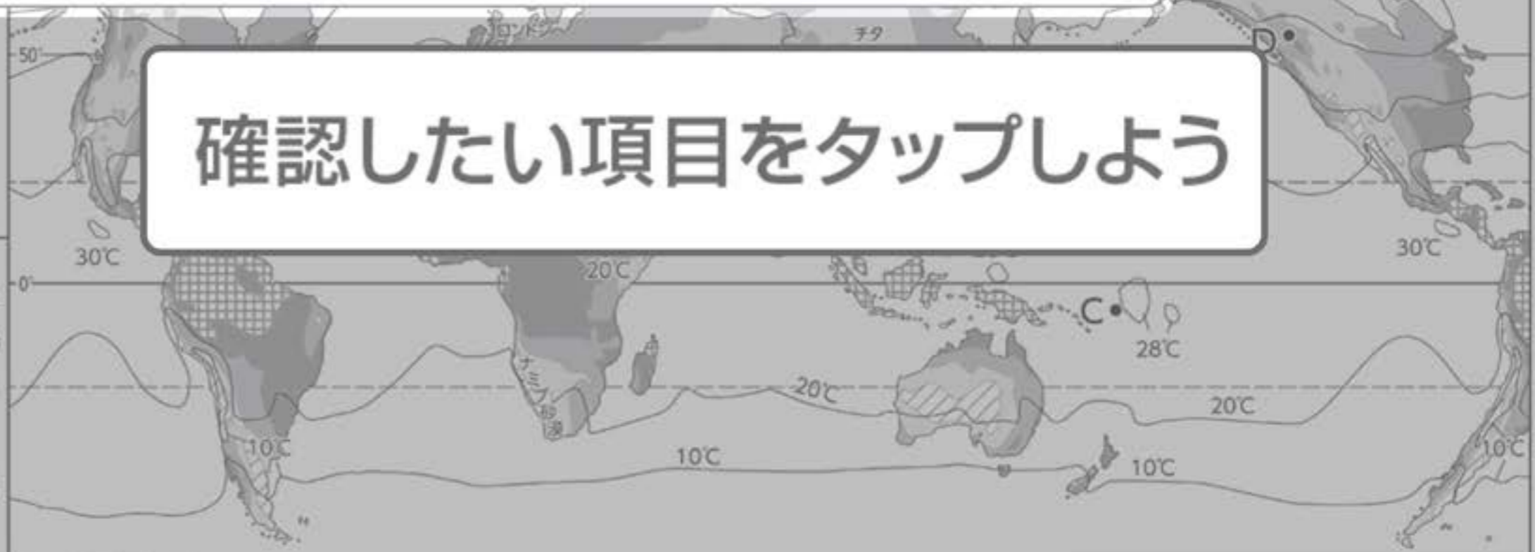
世界の年平均気温・年降水量