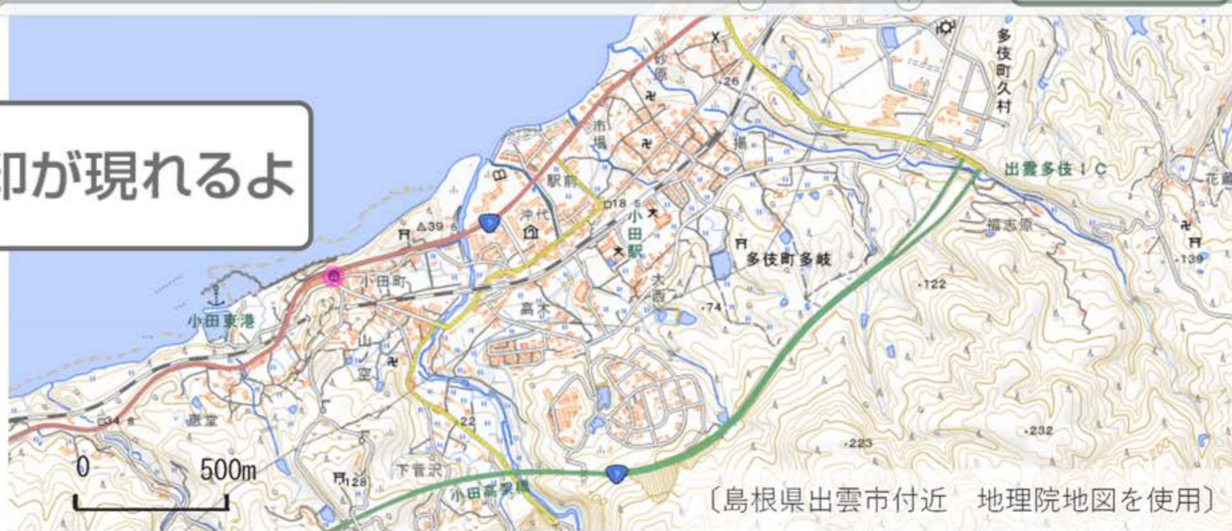
〔島根県出雲市付近〕